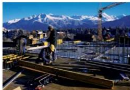
Centre d'épuration de Noës, Sierr

Centre scolaire de Crans Montana Construction du centre scolaire de Crans Montana dans les années soixante. Il s'agit d'un ouvrage particulièrement solide élaboré uniquement en béton apparent.