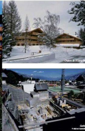
Chalets de 7 à 8 appartements